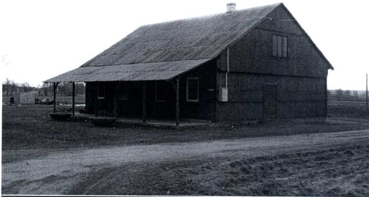
( Budynek świetlicy wiejskiej w Golance )

Zadanie to przewidziane jest do realizacji z udziałem środków Funduszy Strukturalnych w ramach Programu Rozwoju Obszarów Wiejskich oraz środków Ministerstwa Kultury i Dziedzictwa Narodowego. Jednostką realizującą projekt będzie Centrum Kultury Kurpiowskiej w Kadzidle.