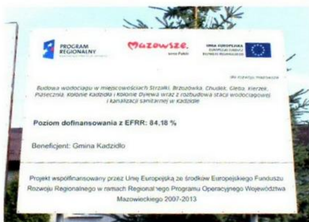
Il. 1 – zdjęcie istniejącej tablicy

Wykonane tablice należy zamontować w miejscowości Kadzidło w miejscu starych tablic na istniejących profilach. Istniejące tablice mają wymiary 2 m szer., 1,5 m wys.