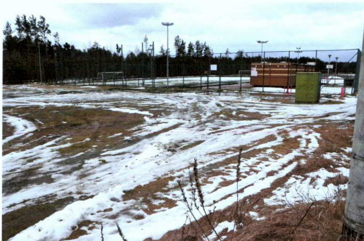
( Teren kompleksu sportowego „ Orlik” )

Zadanie jest zgodne z celem ogólnym drugim Lokalnej Strategii Rozwoju – poprawa warunków życia oraz zaspokojenie potrzeb mieszkańców. Projekt wpisuje się w cele szczegółowe Strategii w zakresie kształtowania przestrzeni publicznej. Zagospodarowanie centrum wsi m.in. poprzez budowę chodników, parkingów i oświetlenia ulicznego wpłynie na poprawę wizerunku miejscowości i jednocześnie realizować będzie misję rozwoju wsi określoną w Planie Rozwoju Miejscowości.