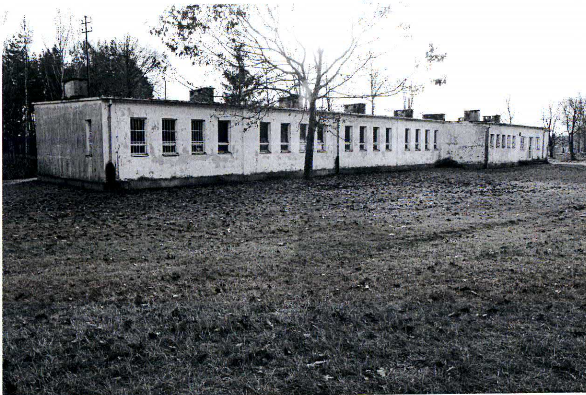
( Budynek w Piaseczni )

Zadanie to przewidziane jest do realizacji z udziałem środków Funduszy Strukturalnych w ramach Programu Rozwoju Obszarów Wiejskich. Jednostką realizującą projekt będzie Gmina Kadzidło